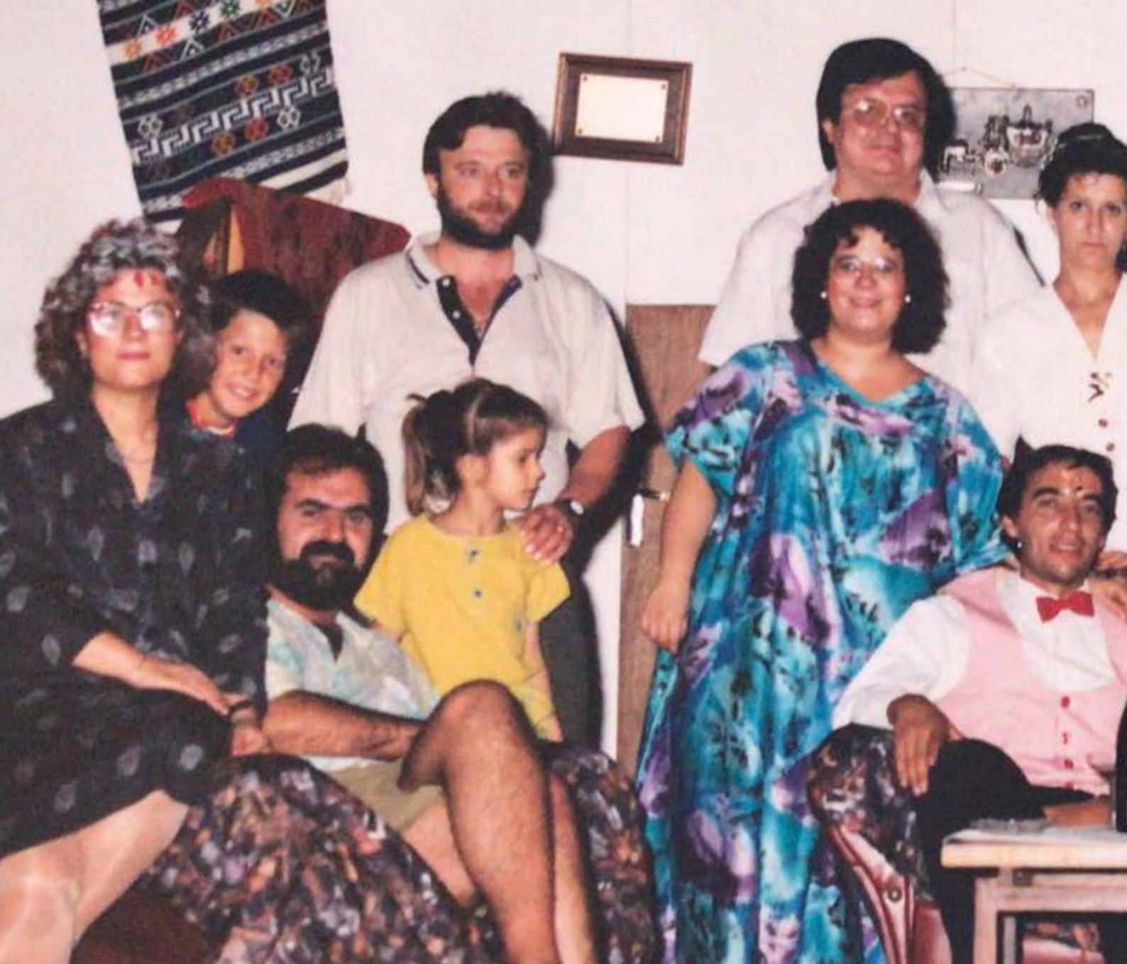
^ Membres del grup de teatre a la representació de Virgo Potens, 1993.